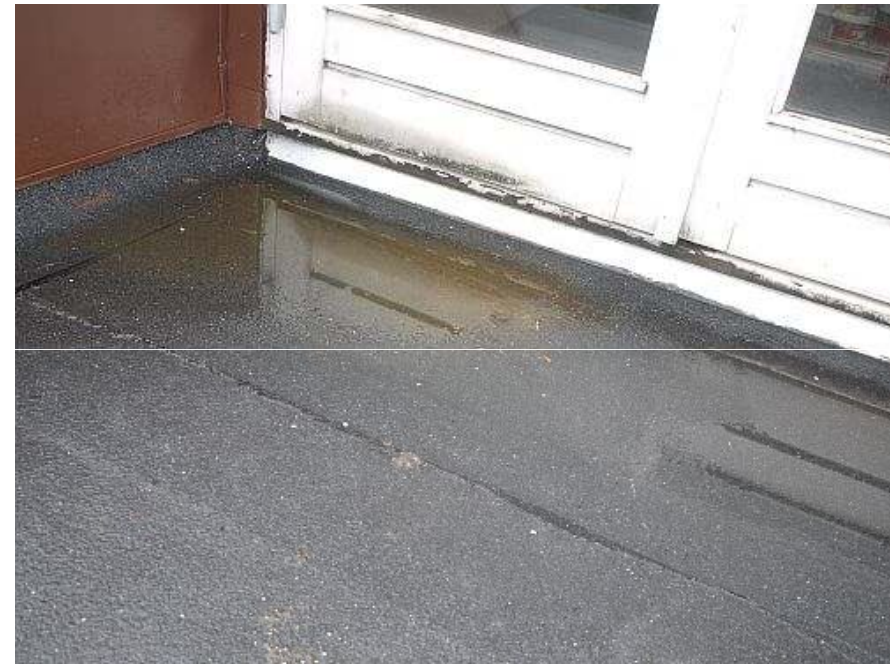
Ingen fald på paptag Vandpyt foran Soldalen 12