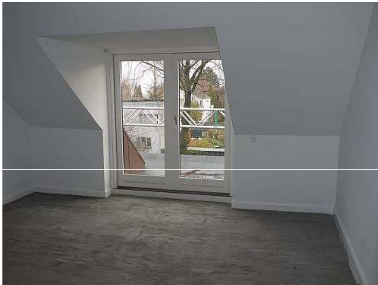
Nr. 10. Nyt gulv er ikke lagt