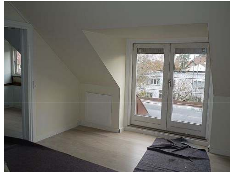
Nr. 12 med nyt gulv af asketræ og kabelbakke i fodpanel. Får efterfølgende isat 3-fløjsdør som specificeret i lokalplan.