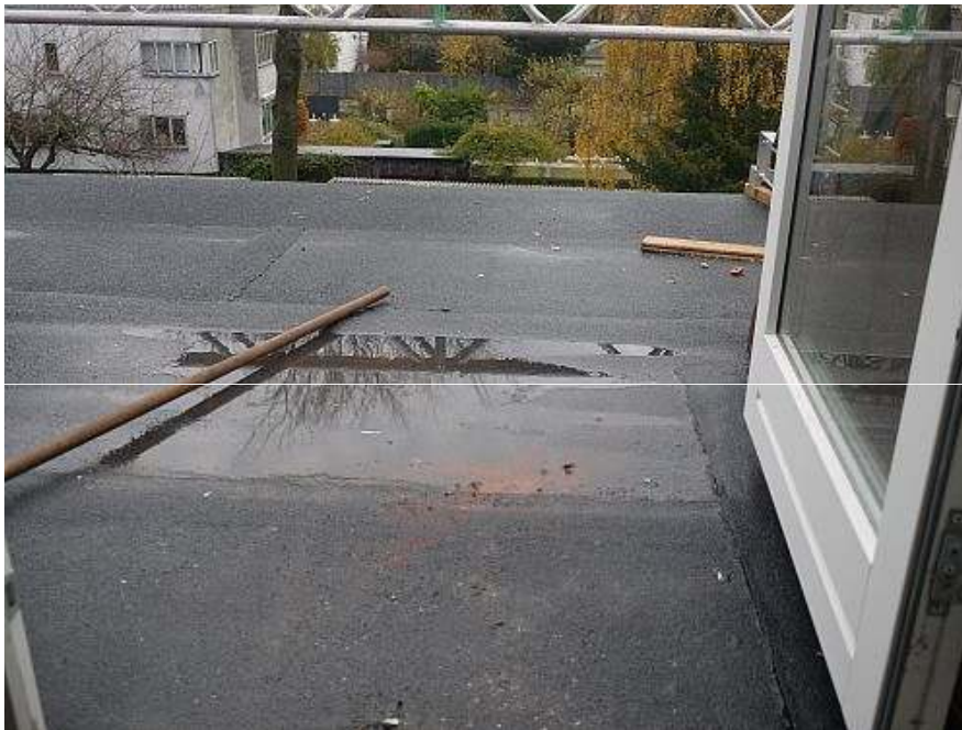
Ingen fald på paptag Vandpyt foran Soldalen 10