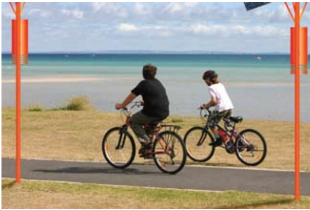
Det er et vigtigt formål med cykelruten at Østerbros og byens børn og unge kan komme trafiksikkert til stranden i Svanemøllebugten