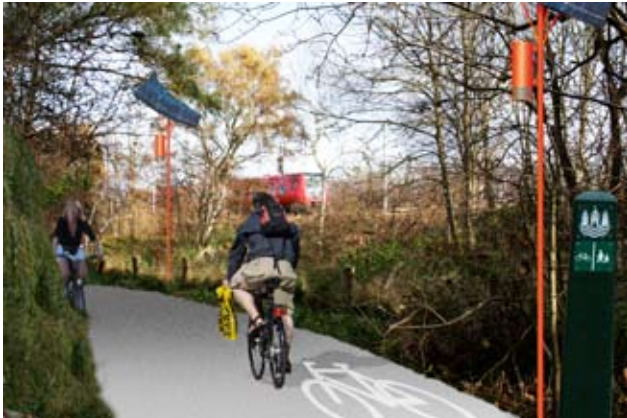
En belagt og belyst sti gennem Ryvang Naturpark mellem søen og jernbanen