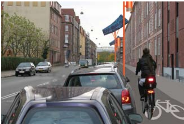
Den nye cykelrute sættes i sammenhæng til den planlagte cykelsti på Vennemindevej mod Fælledparken og city