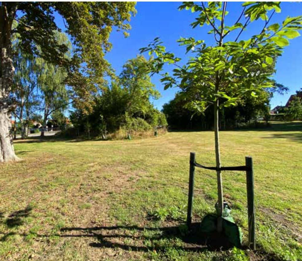
Vanløse Ny Villakvarter har fået støtte fra biodiversitets puljen til begrønning af deres fællesarealer