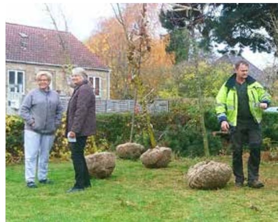
Levering af træer til Vanløse Ny Villakvarter